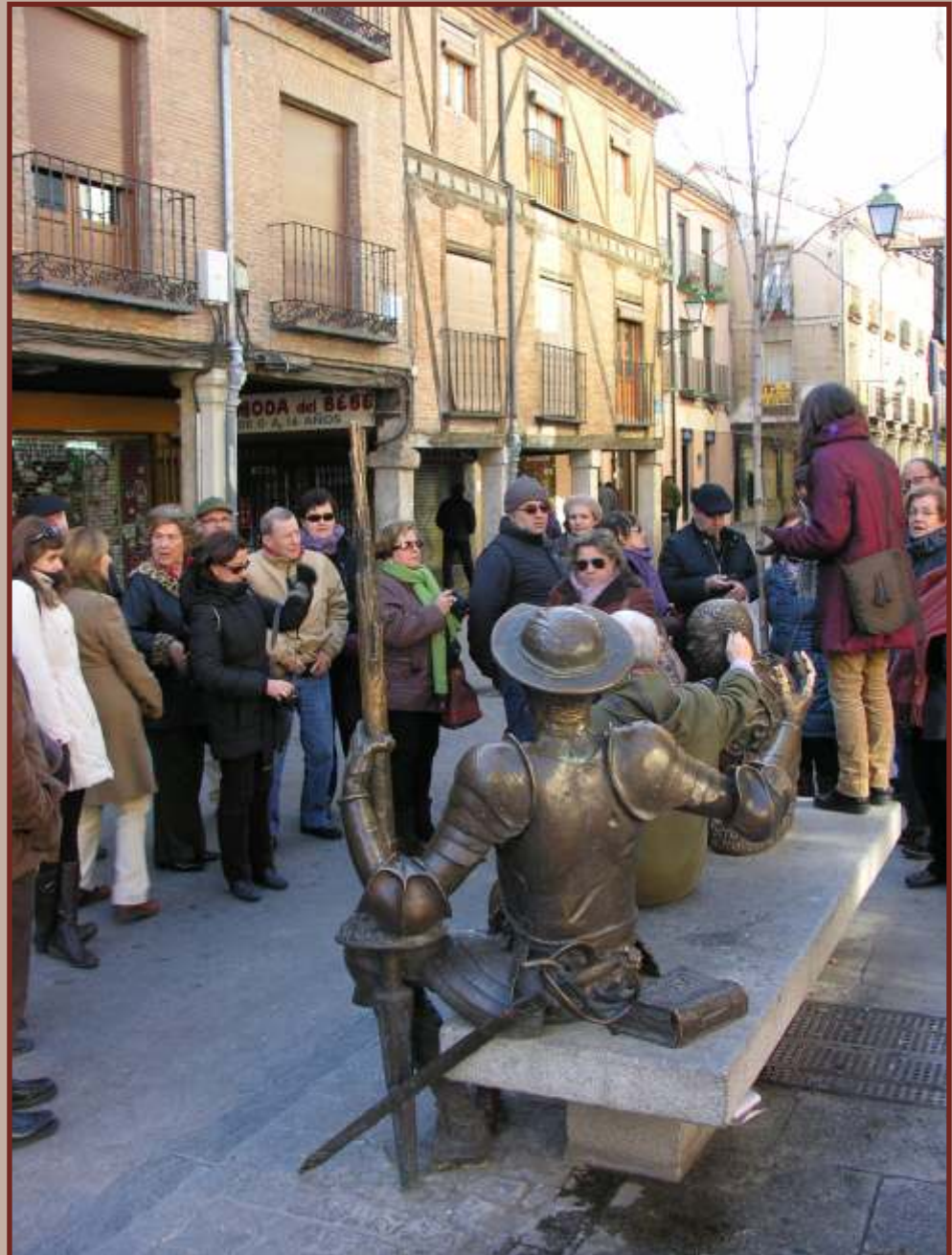
Foto: C/ de Alcalá de Henares. Grupo Mecenas "excursión patrimonial".

BOLETÍN INFORMATIVO DEL PROYECTO MECENAS