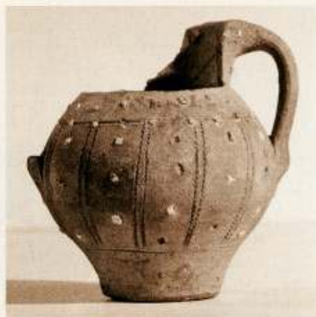
Dibujó: Miguel Alba y Valentín Mateos

Tratamiento superficial: Pared alisada y engobada al exterior con almagra.