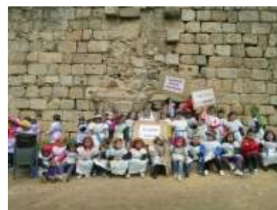
Cooperativa docente Sta. Eulalia. Alcazaba.