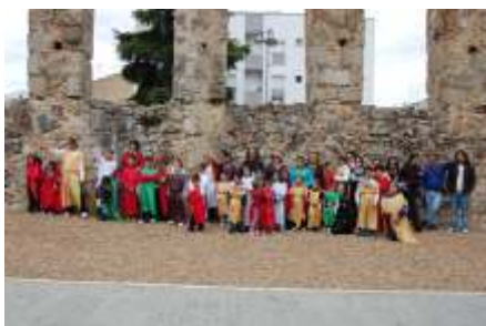
CEIP Antonio Machado. Acueducto de S. Lázaro