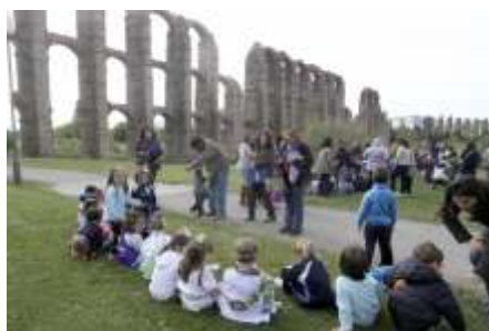
CEIP Ciudad de Mérida. Acueducto de los Milagros.