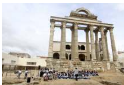
CEIP Suárez Somonte. Templo de Diana.

Al CCMM solo le queda felicitarles, apoyarles y mostrar su disposición de colaboración en un proyecto que seguirá desarrollándose en