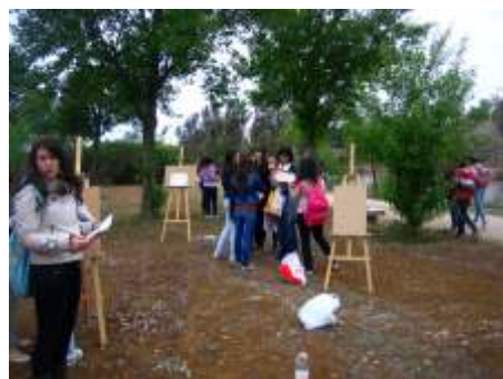
IES Emerita Augusta. Río Guadiana.