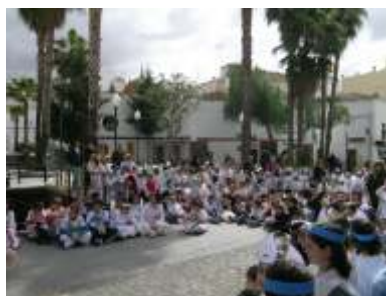
CEIP Trajano. Arco de Trajano.