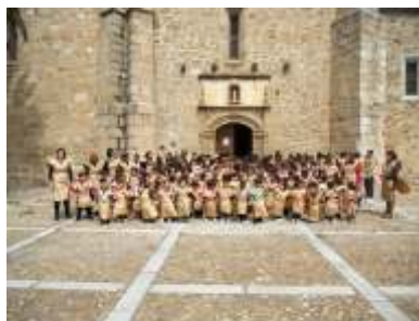
CEIP La Antigua. Ermita de Ntra. Sra. de la Antigua.