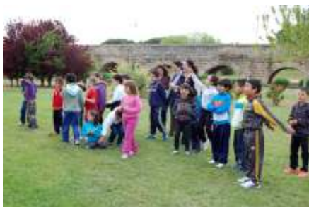
CEIP Dion Casio. Puente romano del Guadiana.

los próximos años y en el que invitamos a participar a otros centros educativos de Mérida.