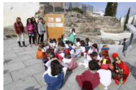
CEIP Federico García Lorca. Castellum Aquae.

Profesores y alumnos de los centros educativos de la ciudad que participan en el proyecto la Escuela Adopta un Monumento han sido, por primera vez en Mérida, los protagonistas de la celebración del Día Internacional del Patrimonio celebrado el pasado 18 de abril. Ellos han sido los que han programado y diseñado las actividades. Los