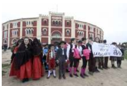
Colegio Sta. Eulalia. MM Escolapias. Plaza de Toros Cerro de S. Albín.