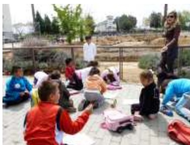
CEIP Juan XXIII. Termas de S. Lázaro.

que han llenado las calles de Mérida para desplazarse a sus respectivos monumentos y, a través de iniciativas lúdicas y artísticas, todas originales y creativas, llamar la atención a sus familiares, vecinos y conciudadanos sobre la vulnerabilidad del patrimonio y la necesidad de protegerlo y conservarlo.