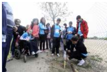
CEE Casa de la Madre. Isla del Guadiana. Río Guadiana.