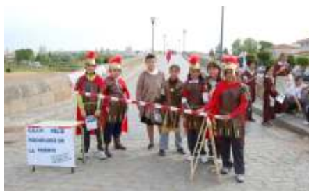
CEIP Rodríguez de la Fuente. Puente romano del Guadiana.