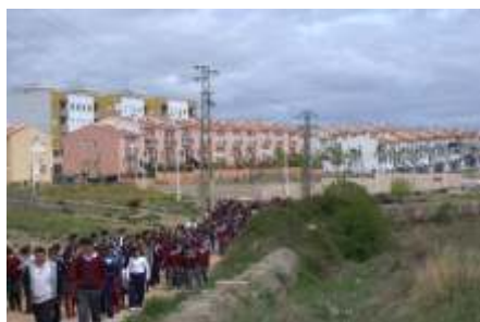
Colegio Ntra. Sra. de Guadalupe. MM Josefinas. Acueducto Rabo de Buey.