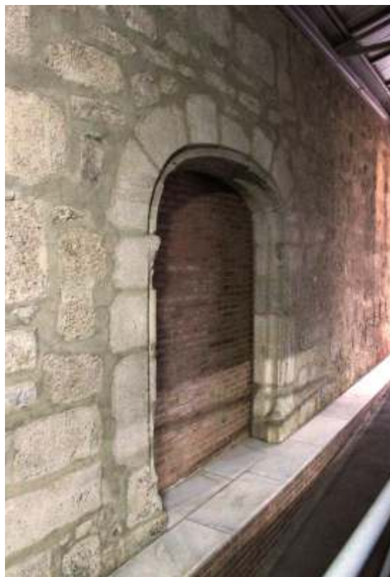
Portada interior del desaparecido convento de San Francisco.

En numerosas ocasiones nos hemos referido a dicho convento de San Francisco como un edificio completamente desaparecido tras la desamortización del siglo XIX con la que pasó a ser propiedad particular. Así mismo, sabemos que en el espacio que ocupó su iglesia, junto con parte del solar del propio convento, se levantó el mercado de Calatrava. Es muy probable que