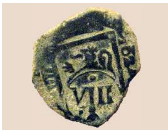
Moneda de vellón resellada en la ceca de Trujillo en 1641.

En ese momento nace la idea de instalar la oficina de resello en Mérida (...disponga el Consejo de Hacienda lo necesario para que se haga en la ciudad de Mérida en una casa particular, donde...se reselle todo el vellón que huviere en aquella provincia...), convertida en plaza de armas debido sobre todo a su posición geográfica cercana a la