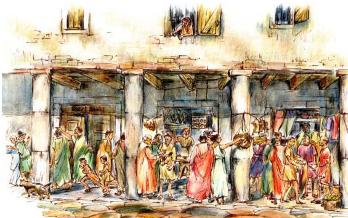
Este dibujo será pronto una foto.