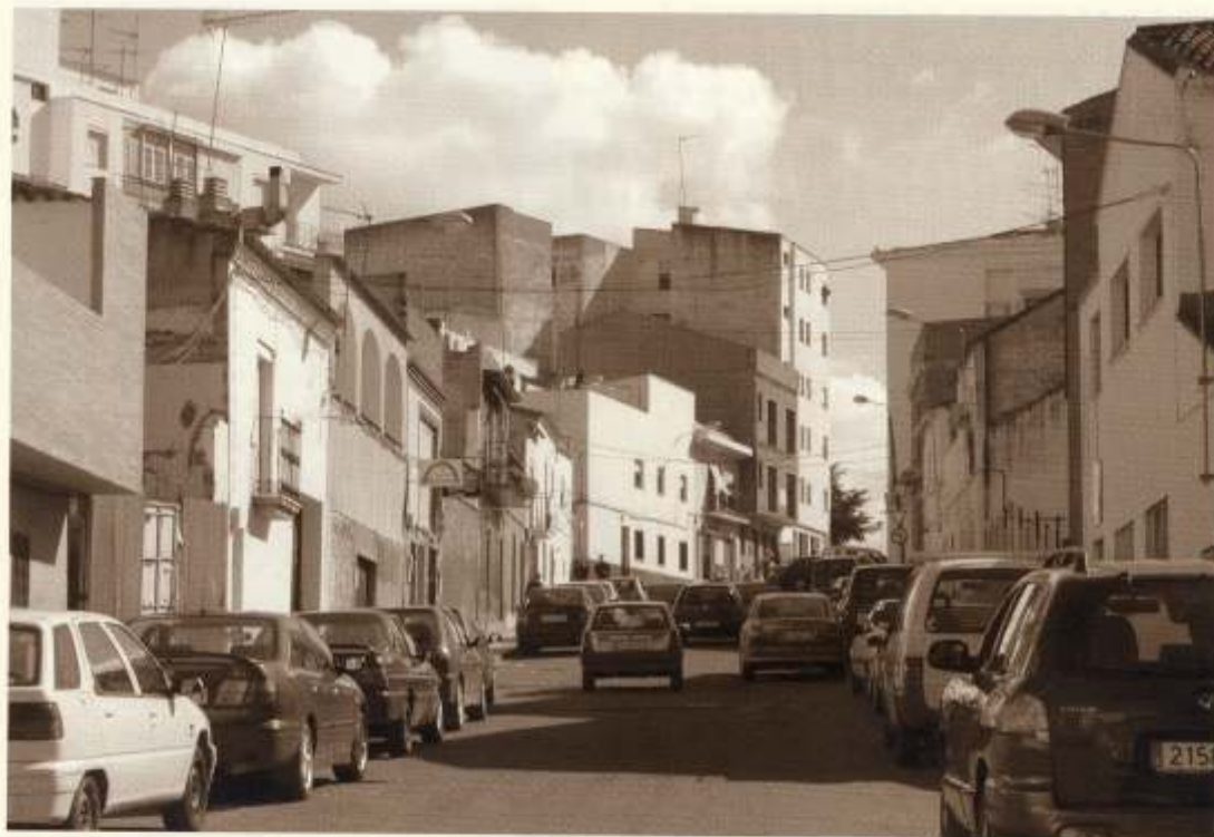
Calle Legión V

esta batalla, entre los años 29 y 19 a.C. los soldados más veteranos fueron desmovilizados, recibiendo tierras en la parte oriental del Imperio.