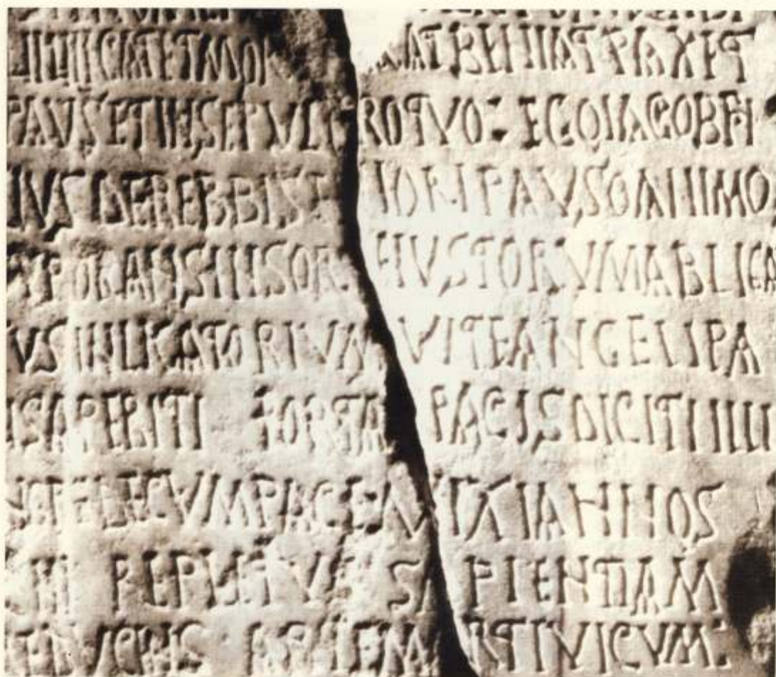
Epitafio del Rabbi Jacob. S. VIII M.A.N.

el primero a finales del siglo XIX, y la otra mitad en la década de los cincuenta del pasado siglo, avalan claramente este poblamiento judío en la metrópolis emeritense. Esta última inscripción, después de los últimos estudios paleográficos llevados a cabo, pertenecería a los comienzos del siglo VIII.