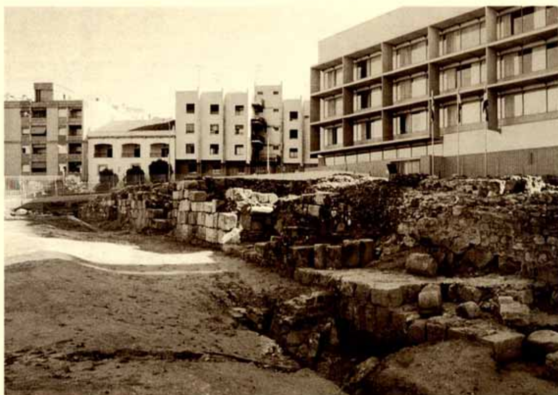
La efectividad defensiva de la muralla romana y su refuerzo de sillares levantado en época visigoda, se puso de manifiesto durante el asedio de las tropas musulmanas.

Según relatan los cronistas islámicos, cuando Muza desembarca en Algeciras rehúsa seguir los pasos de su subordinado Tarik y opta por emprender una ruta muy diferente, hacia el Oeste, aconsejado por los cristianos que lleva como guías, sobre las expectativas de conquista de ciudades de más importancia que las tomadas por su lugarteniente. El punto de destino es Sevilla aunque en el trayecto ocupa, a modo de tanteo, Medina Sidonia y Carmona. La conquista, siguiendo todos los pronósticos, se desarrolla con tanta facilidad, que el siguiente objetivo en su itinerario lo fija en Mérida, la más importante de las ciudades de la Lusitania, sin demorarse en ocupar otros núcleos urbanos de inferior categoría aunque más asequibles a una improvisada campaña militar. Una campaña que, inicialmen-