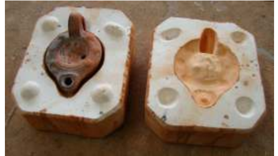
Molde actual que reproduce el sistema de fabricación romano. Taller Terracota, Mérida.

Los alfareros romanos las fabricaban a partir de un molde con dos partes (bivalvo).