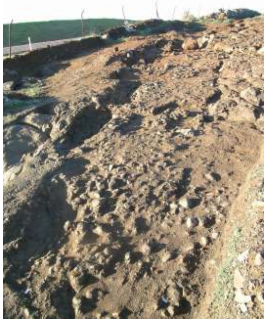
Vista general de la intervención arqueológica.

carbonizados. En algunos casos contenían elementos materiales relacionados con depósitos rituales que nos permiten inferir la existencia de algún tipo de ritual funerario asociado a estas fosas.