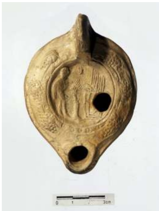
Lucerna erótica con el motivo decorativo muy desgastado Braga (Portugal).

Hoy, en algunos casos, hemos llegado a perder el significado del mensaje original que se mostraba en estas decoraciones. Si no disponemos de los moldes o de las primeras lucernas podemos incluso errar en la interpretación como en el caso curioso que nos ocupa.