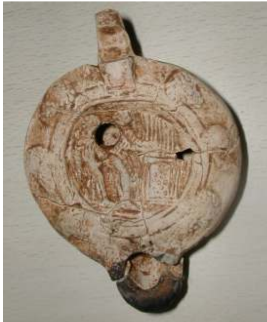
Lucerna de cerámica representando una escena erótica. Mérida.

Sabemos que no solo se fabricaban en barro cocido sino que también se han conservado en bronce como muestran algunas de las presentadas en boletines anteriores. La gran mayoría eran pequeñas. Conocemos ejemplos de lámparas romanas de gran tamaño que incluso formaban parte de candelabros de pie. Las lucernas que queremos presentaros pertenecen al grupo de las más sencillas, las de cerámica.