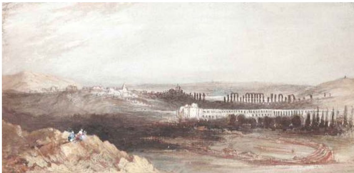
Acuarela. Vista del circo y acueductos de San Lázaro Y Los Milagros.

at home" ( Manual para viajeros por España y lectores en casa ) impresa cinco años después, fue un rotundo éxito editorial, que completó en 1846 con " Las cosas de España ".