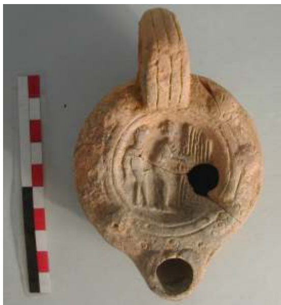
Lucerna con la misma decoración erótica mejor conservada que la anterior. Mérida.

La superficie de la lucerna se decora con escenas que transmiten un mensaje o propaganda romana. Conocemos la existencia de varios talleres de lucernas romanas en Mérida que hemos registrado durante distintas intervenciones arqueológicas.