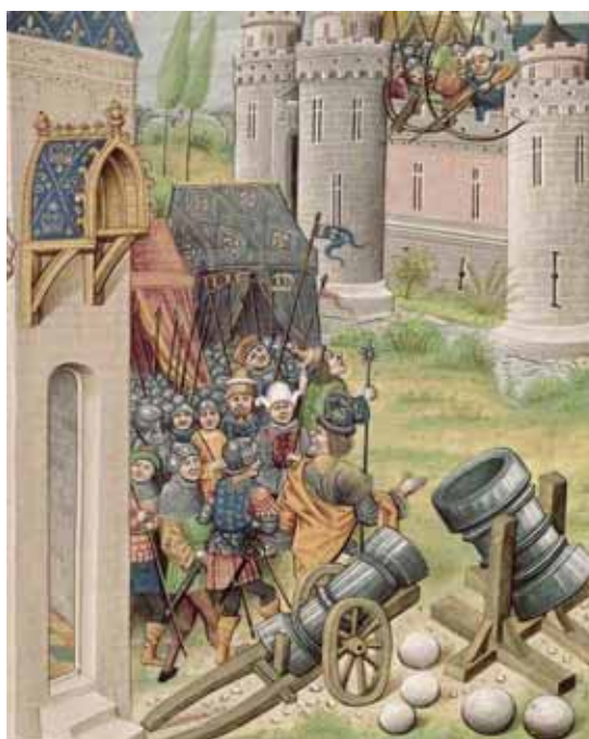
Jean de Wavrin: Recueil des croniques d'Engleterre , c. 1470 c.1480.

El mortero pedrero , conocido originalmente como cuartego , era una pieza de tiro parabólico o curvo para que el bolaño produjera daños dentro de la fortaleza asediada. Su antecedente fue la bombarda trabuquera , que debido a su pequeño calibre no era muy eficaz, por lo que se ideó el mortero, de mayor tamaño (calibre entre 30-50 cm. y bolaños de hasta 150 kg. de peso). Igualmente estaban construidos mediante forja de hierro por lo que tenían poca elasticidad y corrían el riesgo de sobrecalentamiento, pudiendo agrietarse e