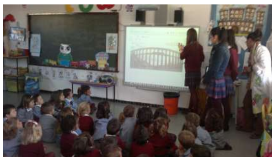
Alumnas de la E.S.O. presentando el Acueducto a sus compañeros más pequeños.