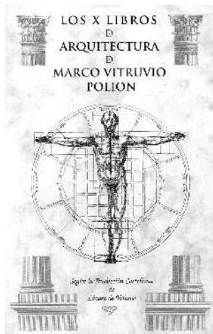
Portada de la edición de F. J. Pizarro y P. Mogollón a la traducción de Lázaro de Velasco (1564).

La necesidad de fundar ciudades (o adaptar las precedentes) según avanzaba la conquista en América hizo que se buscarán referentes en el mundo romano. Ni Toledo, Granada, Valladolid o Madrid, ciudades en las que se estableció la corte, sirvieron de modelo para su reproducción en América. La corona impulsó nuevas fundaciones basadas en lo que los romanos habían hecho en Hispania y en los tratados que teorizaban sobre ello. La propia Roma era casi irreconocible por su particular evolución durante la larga Edad Media, si bien su esplendor se manifestaba en sus muchas ruinas. Así es como los humanistas, y más tarde, los ilustrados acuden hasta Mérida para conocer los elementos de una ciudad romana y cómo fueron construidos acueductos, presas, puentes, calles empedradas, conducciones de evacuación, etc.; los aspectos técnicos, como las medidas y proporciones de los edificios, los sistemas constructivos y los