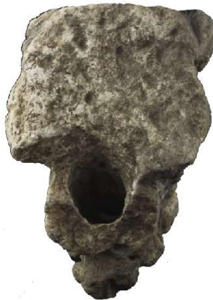
Vista lateral y posterior del surtidor de agua con representación de Sileno