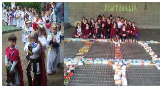
“Fontinalia”: la construcción de un acueducto solidario

Con la entrega del certificado de adopción del Acueducto rabo de buey- San Lázaro, los alumnos se pusieron a la tarea recogiendo información sobre su monumento. Tenían claro que para valorarlo y tomar consciencia de la importancia de su conservación, antes necesitaban conocerlo bien. Para apoyarlos, el Consorcio organizó una visita guiada al acueducto y una charla en el colegio.