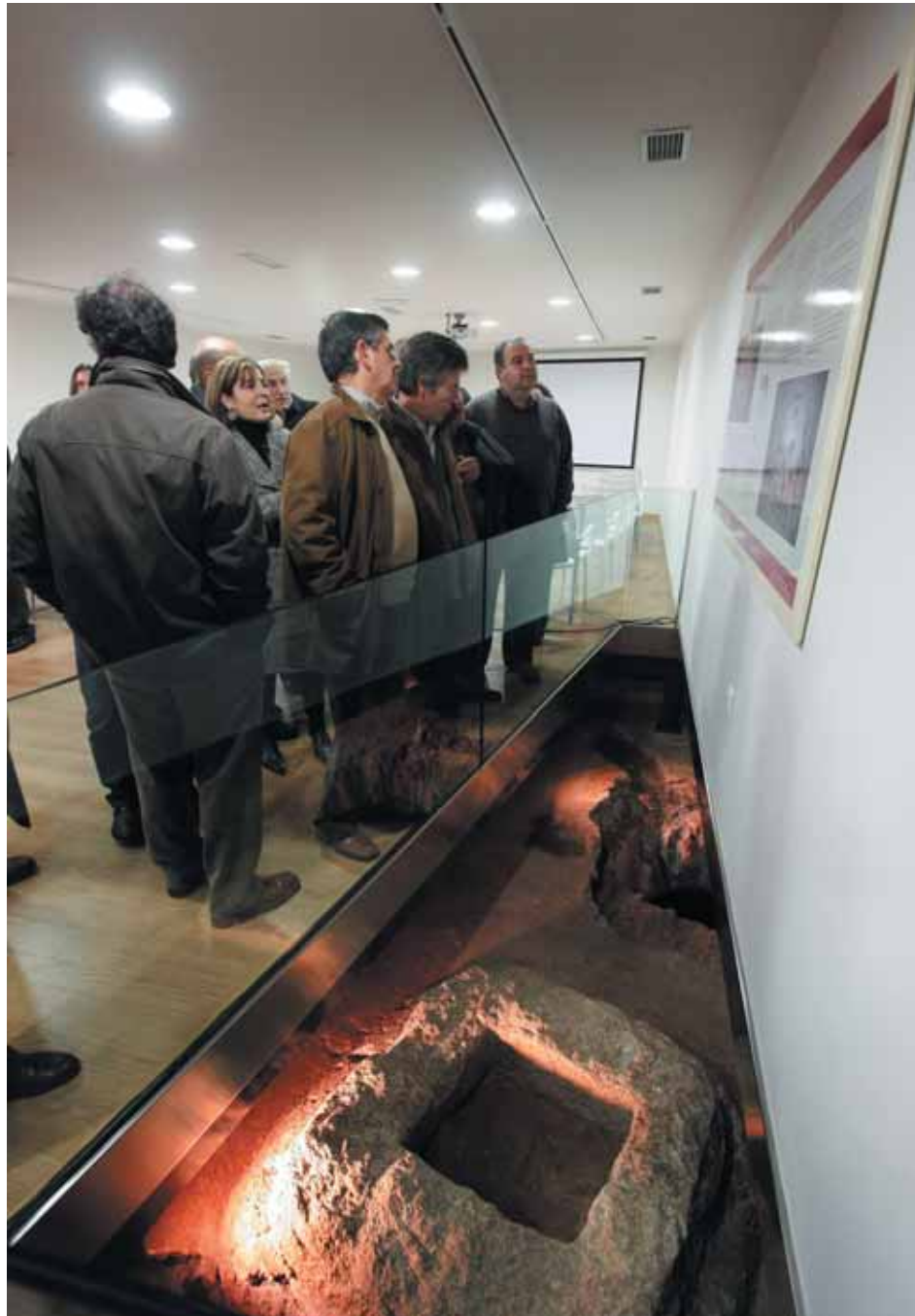
Restos arqueológicos en la Sala Decmanvs.

En verano, Semana Santa y puentes, el horario de visita al Teatro y Anfiteatro es ininterrumpido.