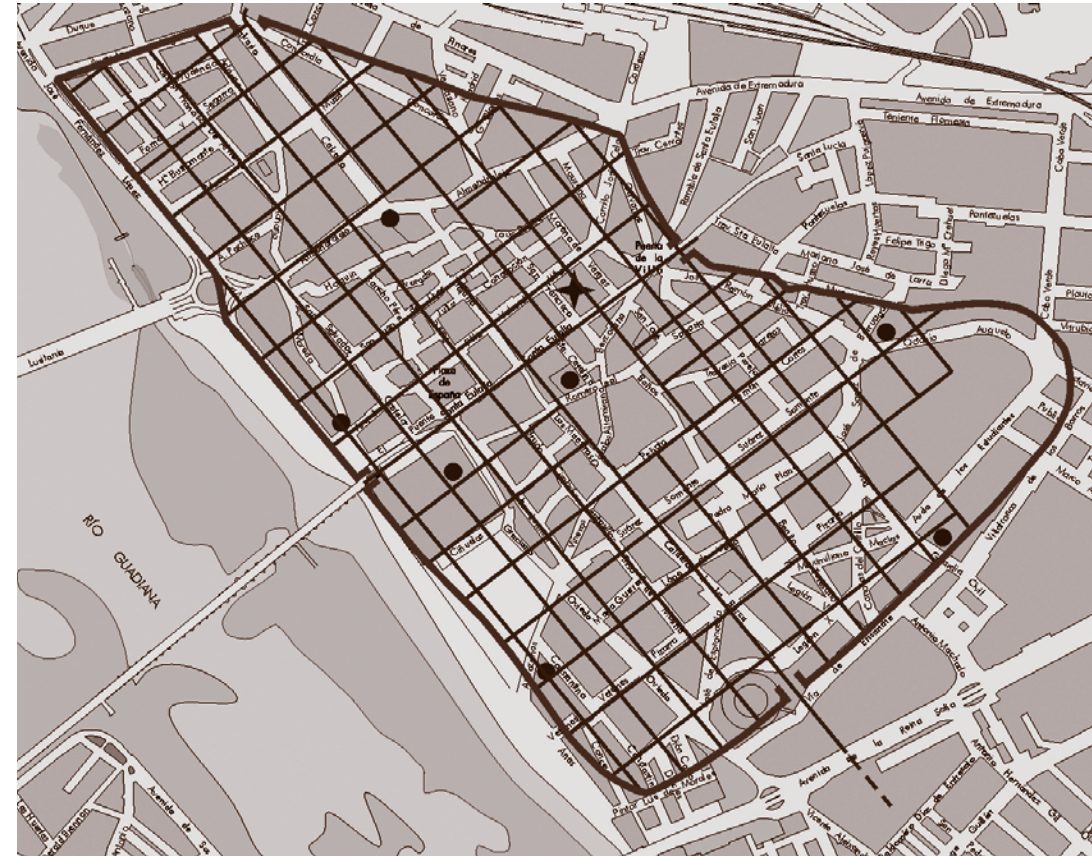
Plano de la ciudad de Mérida con el viario romano.