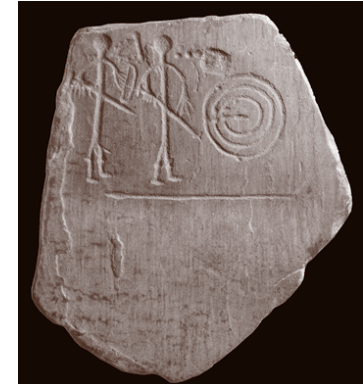
Estela de Capilla.

Las reuniones bienales Sidereum Ana tienen como objetivo tratar temas sobre la protohistoria del Guadiana y contar con una nutrida presencia de investigadores portugueses fortaleciendo, así, los lazos transfronterizos. El tema elegido en esta ocasión es el Guadiana en el Bronce Final.