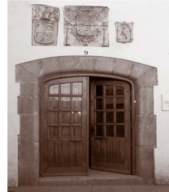
Edificio de la canicaría. C/ Del Puente

El espíritu de la ciudad renacentista se transmitió, en mayor medida, en las intervenciones para el acondicionamiento de la Plaza y de los edificios que se habilitaron para acoger determinados servicios públicos que se instalaron en ese mismo espacio o sus proximidades. En 1543 se realizó una obra en la Plaza a fin de allanar y despedregar su centro –fuera de los soportales–, a la vez que se empedraron las cunetas por donde corría el agua.