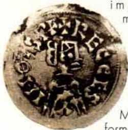
Triente de Recesvinto

importante mosaico, conocido como "Mosaico de los Siete Sabios", hoy en el MNAR, que formaría parte de la misma casa que ahora documentamos, pues tanto los pavimentos musivos como los baños privados sólo se usaron en las grandes domus (viviendas de lujo).