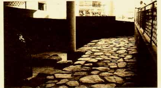
Aplicación del punto 2, restos del Decumanus Maximus .

ción y poseen una unidad constructiva suficiente para explicar al ciudadano algunas de las características de la ciudad en otras épocas. En este caso la Comisión señala unas normas que deben presidir la edificación del solar de manera que los restos sean visibles al público y puedan cumplir un fin social (sala de exposición, centro cultural, yacimiento visitable, etc.). Ejemplos de este tipo de actuaciones son el Centro Cultural de la C./John Lennon, el edificio situado en la Puerta de la Villa o la Iglesia de Santa Eulalia, por citar los más recientes.