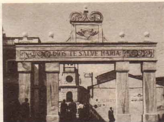
Con motivo de la visita de Alfonso XIII.