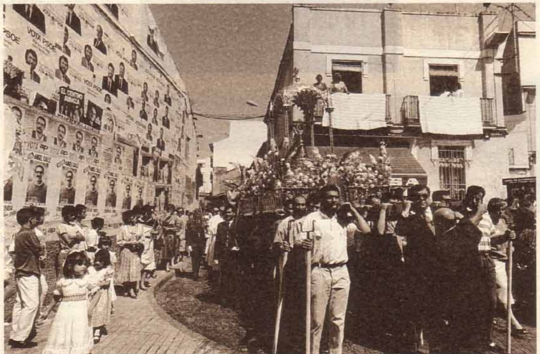
Procesión del Corpus