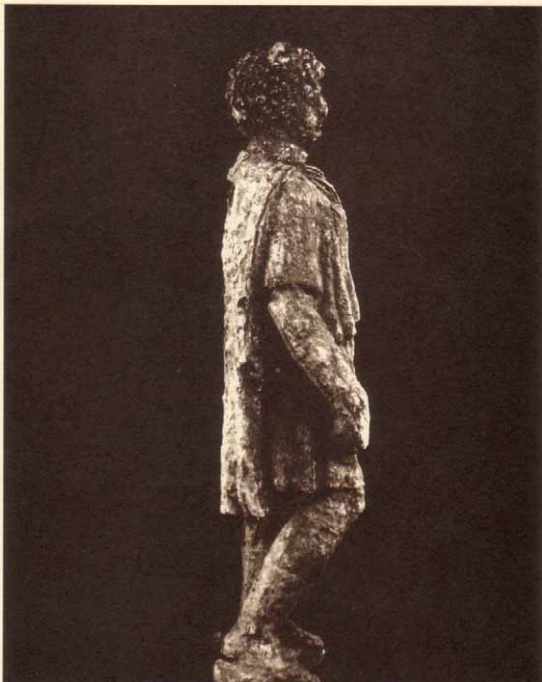
Figura femenina de bronce localizada en Morelia.

BOLETÍN INFORMATIVO DEL CONCORDIO DE LA CIUDAD MONUMENTAL, HISTÓRICO-ARTÍSTICA Y ARQUEOLÓGICA DE MÉRIDA