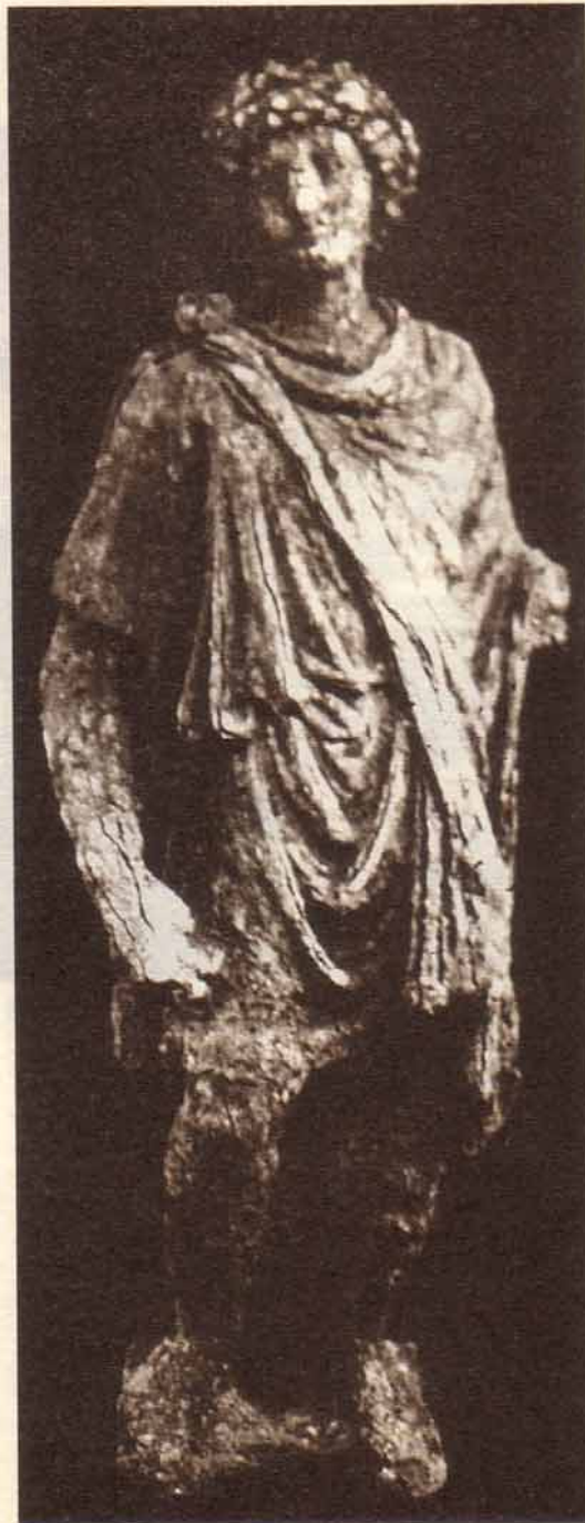
Figura femenina de Morería

Las excavaciones que actualmente se realizan en la Zona Arqueológica de Morería continúan deparando hallazgos puntuales de gran importancia. Si bien el objetivo de las excavaciones es recuperar la secuencia histórica de esta zona de la ciudad a lo largo de los siglos, la aparición de piezas relevantes por su calidad artística y técnica suponen un dato importante para conocer los gustos y formas de vida en una época determinada de la historia.