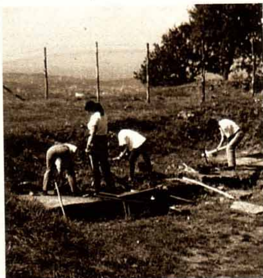
Miembros del Consorcio trabajando en Tusculum

El Consorcio de la Ciudad Monumental de Mérida es Unidad Asociada al Consejo Superior de Investigaciones Científicas (CSIC). Gracias a esta relación, los miembros de la Unidad Asociada pueden solicitar proyectos de investigación financiados por la Dirección General de Investigación Científica y Técnica. En este marco se encuadra el Proyecto de Estudio y Excavación