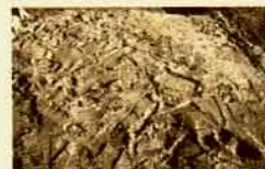
Cubrimiento y protección de restos arqueológicos.

mente podemos conocer la profundidad, características, usos y cronología de todos los restos que han sido excavados y actualmente se encuentran enterrados, localizándose por medio del plano arqueológico de la ciudad que, día a